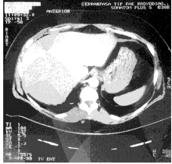
Şekil 2. Olgumuzda tanının verifiye edilebilmesi için çekilen ince kesitli spiral toraks BT'si

tanısı konan hasta pulmoner anjiyografi yapılmasına gerek duyulmadan operasyon amacı ile Göğüs Kalp Damar Cerrahisi Ana Bilim Dalı'na sevk edildi. Yapılan operasyonda; sağ akciğer alt lob posterior bazal segmentte içi püyü dolu kistik yapı saptandı ve bu kistik yapının içinde loküle abse odakları görüldü. Akciğer bazalinde pulmoner venin yakınında, pulmoner ligament hizasında özefagusu doğru uzanan 5mm çapında bir arterin direkt olarak sağ toraxa girdiği ve medial bazal ve lateral bazal segment alanına direkt kan verildiği görüldü. Arter bağlanarak kesildi ve posterior segmentektomi yapıldı, kalan segmentlerin tamamen sağlam olduğu gözlemlendi. Müsterek segmenti besleyen başka arterin olmadığı saptanması üzerine operasyon tamamlandı. Operasyon materyalinin patolojik incelemesinde de intralober sekestrasyon tanısı desteklenen hasta genel durumunun düzelmesi ve yakınmalarının gerilemesi üzerine poliklinik kontrollerine gelmesi önerilerek taburcu edildi.